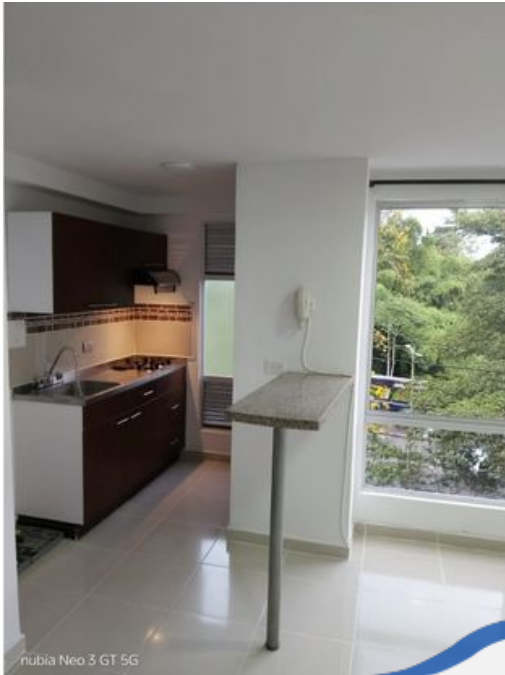
nubia Neo 3 GT 5G